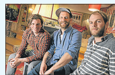
Die Sportfreunde Stiller klingen wie eh und je.