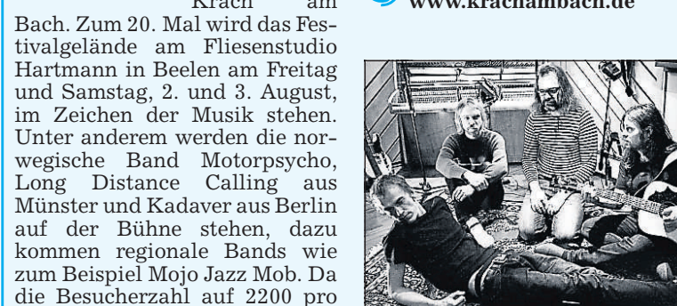
Motorpsycho geben ihre Visitenkarte bei Krach am Bach ab.