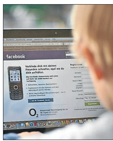
Vor allem über soziale Netzwerke versuchen fragwürdige Organisationen, mit Jugendlichen in Kontakt zu treten.

„Das sind Versuche, sich das Vertrauen der Jugendlichen zu erschleichen“