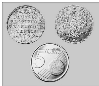
Abb. 137: Frankfurter Dukat aus Goethes Geburtsjahr. (Zum Größenvergleich: ein Fünf-Cent-Stück). Die Aufschriften lauten: DUCATUS REI PUBLICAE