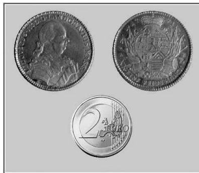
Abb. 90: Ein Gulden aus der Landgrafschaft Hessen (=Hessen-Darmstadt) aus dem Jahre 1771 (zum Größenvergleich: ein Zwei-Euro-Stück). Die Aufschriften lauten: LUDOVICUS IX D:G (=DEI GRATIA) LANDGRAVIUS HASS. (=HASSIAE) und: 1771 - XX EINE FEINE MARK. (Historisches Museum Frankfurt a.M.)

'Gulden' war im 18. Jahrhundert in Deutschland sowohl Münze wie Rechnungseinheit und bedeutete eine Münze mit einem Silberanteil von ca. 13 Gramm (Raugewicht ca. 15 Gramm), nämlich 20 Stück aus der feinen Mark, die im 18. Jahrhundert einem Silbergewicht von ca. 260 Gramm entsprach. Auch halbe oder Zwei-Drittel-Taler mit diesem Gewicht wurden