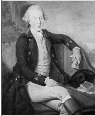
Abb. 146: Johann Georg Ziesenis (1716-1776): Herzog Ernst Ludwig von Sachsen-Gotha (1768). (Berlin, Staatliche Museen)