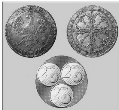
Abb. 94: Frankfurter Konventionstaler aus dem Jahre 1763 (zum Größenvergleich: drei Zwei-Cent-Stücke). Die Aufschrift lautet: AD NORMAM CONVENTIONIS. X - E - F Mark (= Zur Norm der Konvention, 10 von einer feinen Mark). NOMEN DOMINI TURRIS FORTISSIMA 1763 (=Der Name des Herrn ist die stärkste Burg). (Münzkabinett der Dresdner Bank Frankfurt a.M.)

Auch wenn das Wort von den 'tausend Talern' nur eine Redewendung ist - es handelt sich dabei um eine durchaus kalkulierbare Summe. Der Konventionstaler war eine Silbermünze im Raugewicht (Silberanteil 900/1000) von ca. 29 Gramm, d.h. er enthielt ca. 26 Gramm reines Silber. (Die reichseinheitlich gewichtete 'Mark' bedeutete im 18. Jahrhundert ca. 260 Gramm Silber.) Bei eintausend Talern wären also 26 kg Silber zusammengekommen - schon 10% mehr als die Menge, die Goethe bei seinem Amtsantritt in Weimar 1776 als Jahresgehalt erhielt (nämlich 1200 Reichstaler; der Reichstaler war mit ca. 21 Gramm ein Viertel weniger wert als der Konventionstaler). Zehn Jahre später betrug Goethes Gehalt allerdings schon das Doppelte.